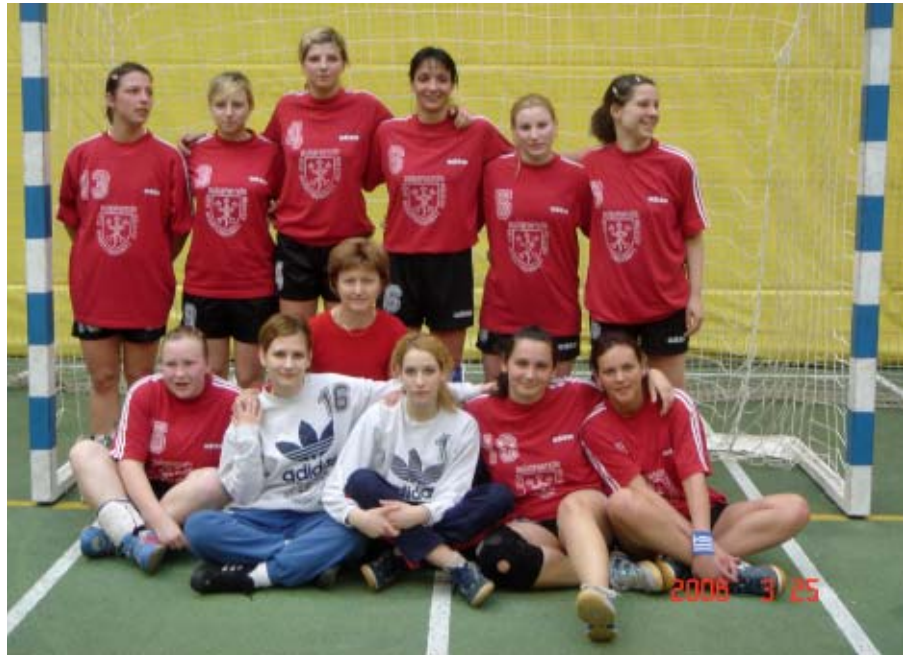
NŐI KÉZILABDA – I. HELY