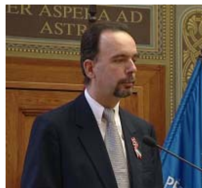
P. Müller Péter