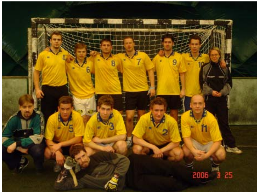
KISPÁLYÁS LABDARÚGÁS – I. HELY

res rendezés érdekében. A sportági versenyek többsége (kézilabda, röplabda, kosárlabda) a Semmelweis Egyetem Testnevelés Főiskolai Karának sportlétesítményeiben zajlottak. A labdarúgás helyszíne is tíz perces sétával elérhető volt, így lehetőség volt arra, hogy hallgatóink egymás mérkőzéseit megtekinthessék és szurkoljanak a sikerért. A szegedi, a debreceni és a pécsi küldöttség is egy helyszínen, a gyönyörű fekvésű és felújított Csillebérci tábortan volt elszállásolva. Estéknként kulturális programokról is