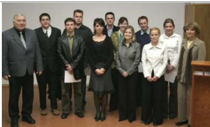
II. (bal oldali kép) és III. díjasok (jobbra)