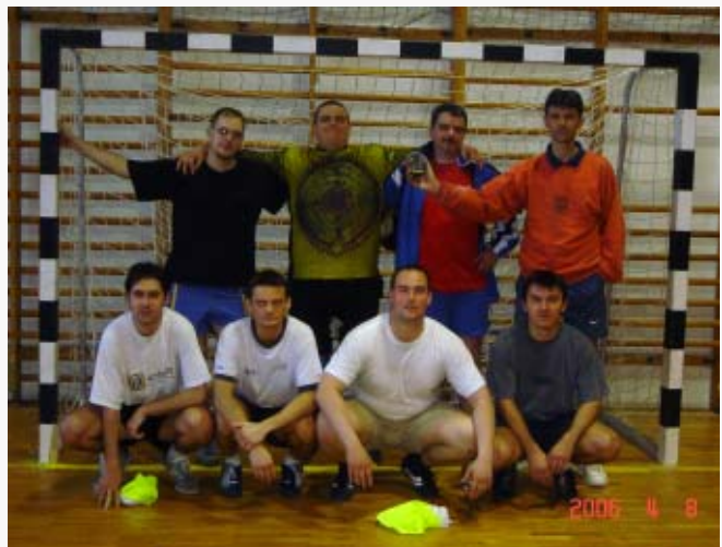
A fotón a második helyezett AITI csapata látható.