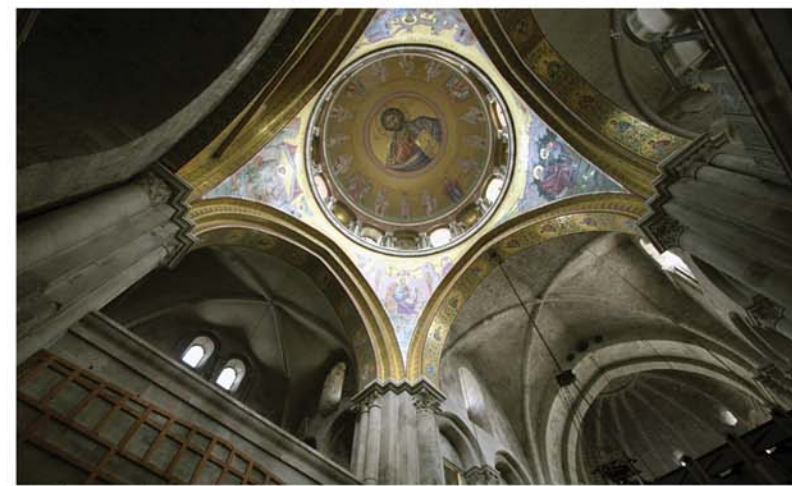
A Szent Sír temploma