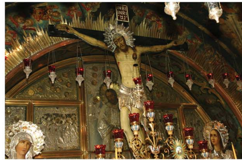
A Szenvedések útja