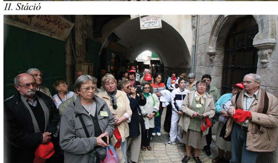
Zarándoklat a Via Dolorosán