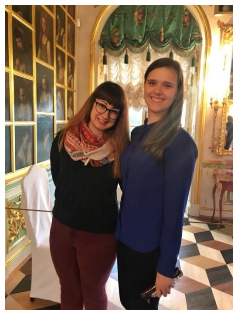
Petergof, Nyári palota