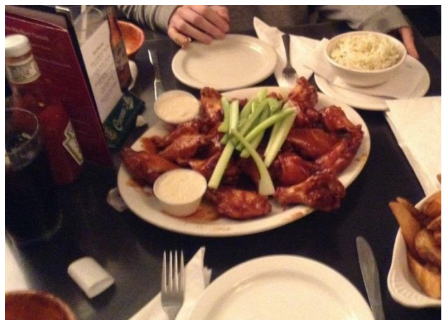
Original buffaloi csirkeszárnyak