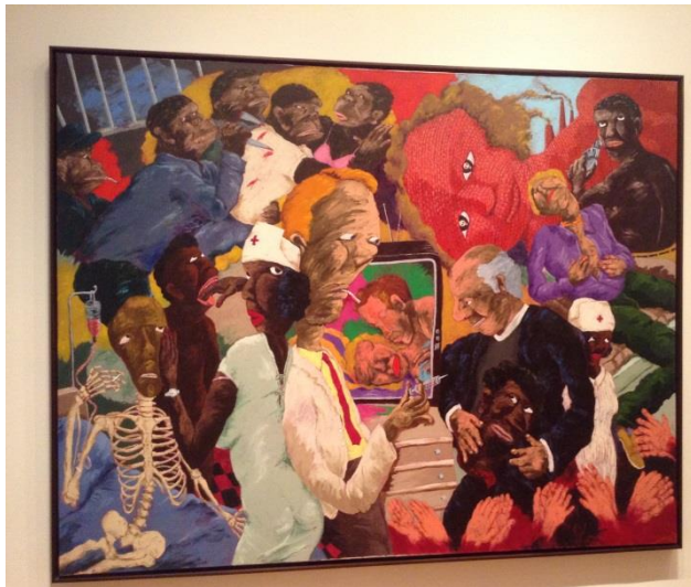
A kép címe – Emergency Room