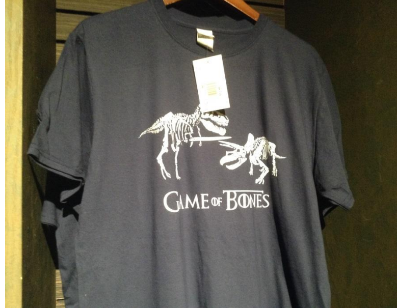
Készülve az utolsó évadra