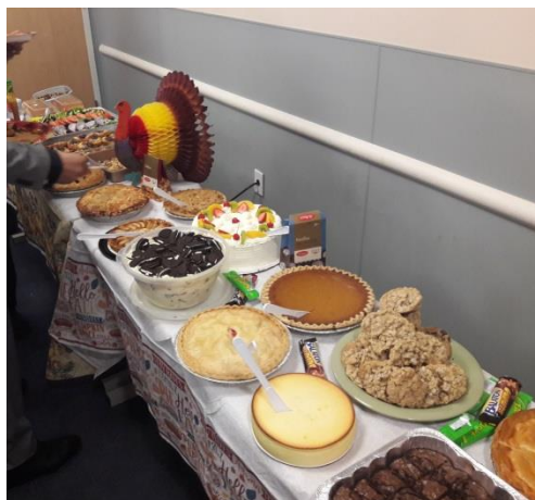
Hálaadás party a konferenciateremben