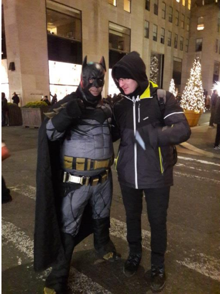
Nagyon meggyőző, de szerintem ő nem az igazi