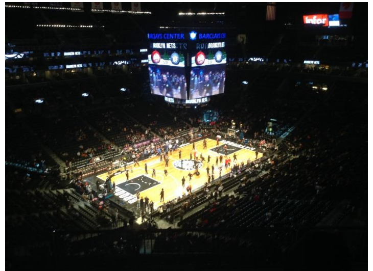
Brooklyn Nets a Barclays Centerben