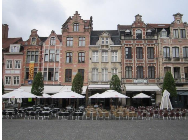
Oude Markt (Leuven)