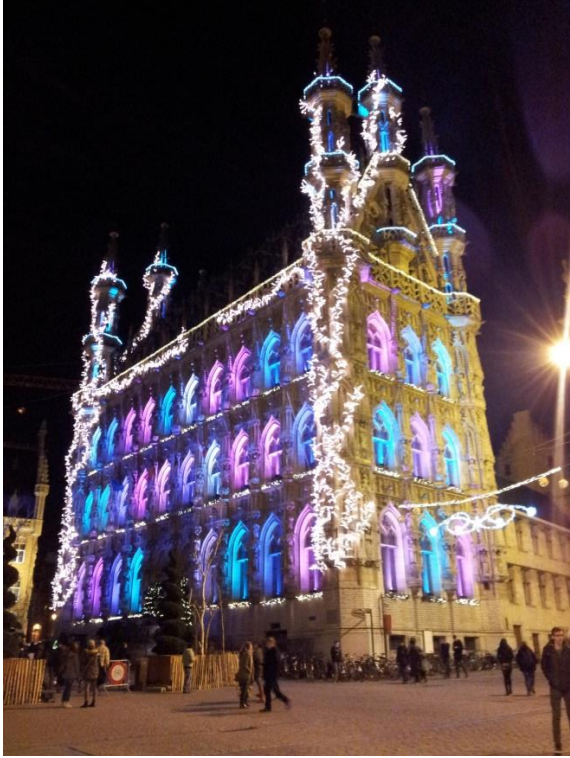
Városháza karácsonyi fényekben (Leuven)