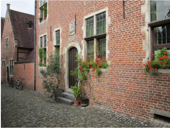
Groote Begijnhof (Leuven)