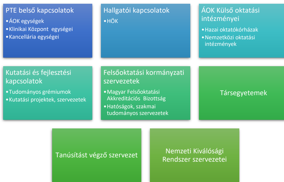
2. ábra: A PTE ÁOK Minőségirányítási és Intézményfejlesztési Osztály kiemelt érdekelt felei

Az együttműködés módját a Kar Szervezeti és Működési Szabályzatában foglaltak határozzák meg.