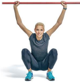
1 mély guggolás

MOZGÁSMINTA SZŪRÉS 7 LÉPÉSBEN A BALANCE MOZGÁSBAN