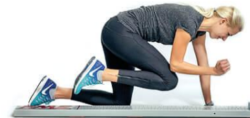
7 rotációs stabilitás