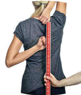
4 váll mobilitás