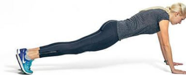
6 fekvőtámasz - törzs stabilitás